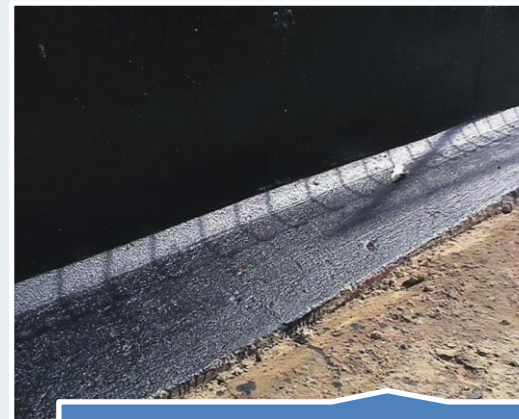
Zabezpieczenie przejść pion/poziom