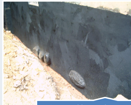
Odporność na ciśnienie do 80 m słupa wody